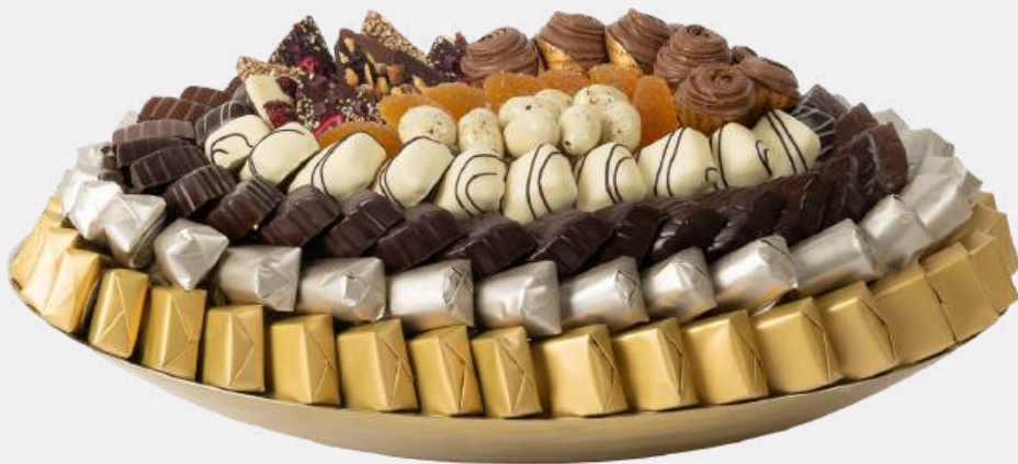
Ref0050 Coupe ovale métal brossé PM L= 38 cm l= 28 cm H= 5 cm 1800 g - 1 980 MAD