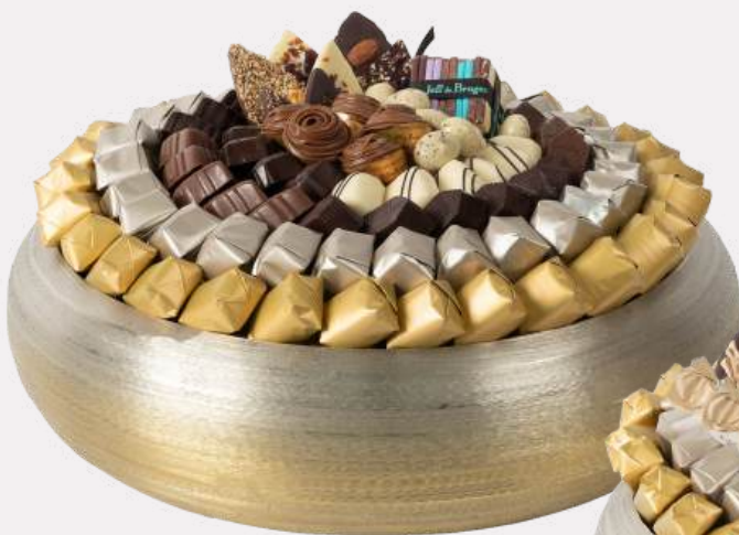
Ref0052 Coupe ronde métal brossé GM Ø = 30 cm H= 11 cm 1750 g - 2 300 MAD