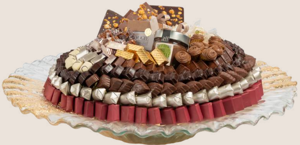
Ref0036 Centre de table Murano PM Ø = 44 cm H= 12 cm 2000 g - 2 880 MAD