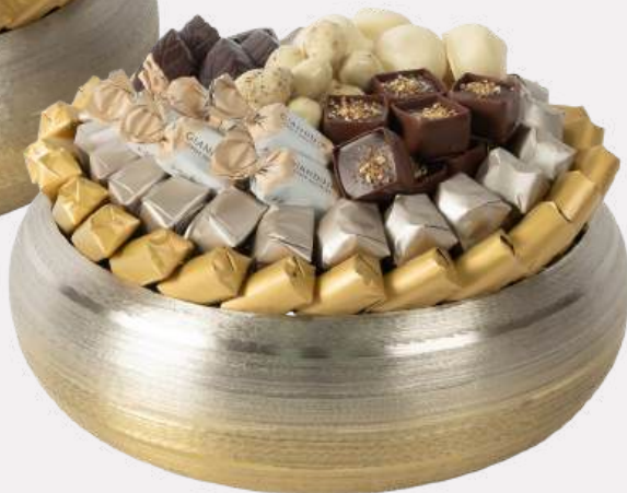
Ref0053 Coupe ronde métal brossé PM Ø = 25 cm H = 9 cm 1250 g - 1 600 MAD