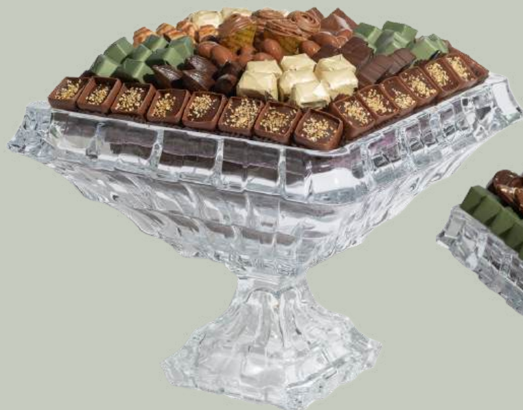
Ref0030 Coupe cristal carrée sur pied L= 28 cm l = 28 cm H= 22 cm 1200 g - 1 1