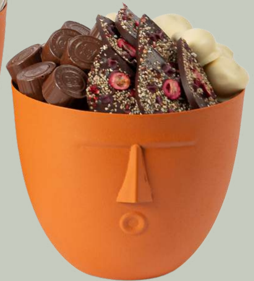
Ref0012 Pot tête GM Ø = 18 cm H= 15 cm 600 g - 720 MAD