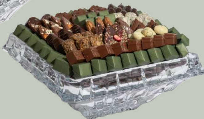
Ref0031 Coupe cristal carrée L= 28 cm l = 28 cm H= 12 cm 1200 g - 1 1