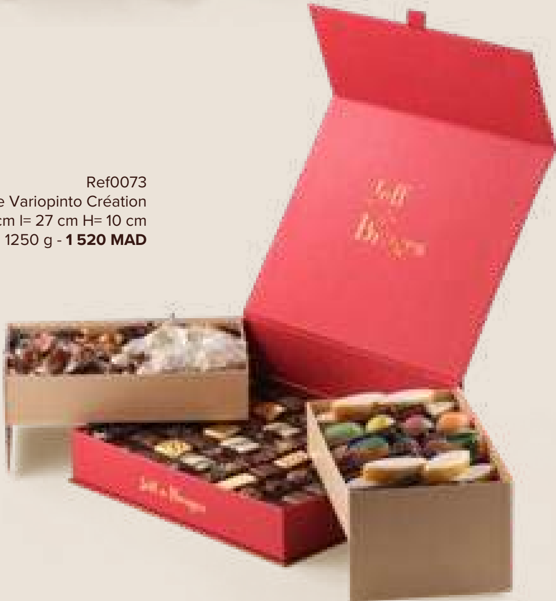
Ref0073 Boite Variopinto Création L= 22cm l= 27 cm H= 10 cm 1250 g - 1 520 MAD