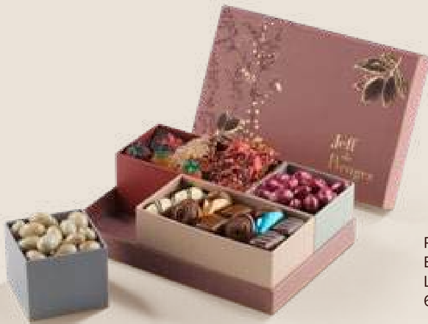
Ref0072 Boite Variopinto Multibloc L= 27 cm l= 27 cm H= 10 cm 650 g - 790 MAD