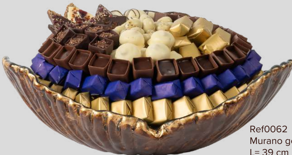
Ref0062 Murano gold blue GM L= 39 cm l = 39 cm H = 20 cm 2500 g - 1 1