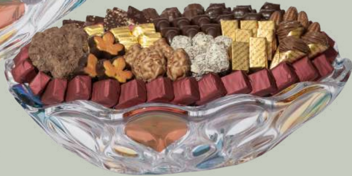
Ref0025 Coupe cristal colorée L= 36 cm l = 23 cm H= 12 cm 1300 g - 1 1