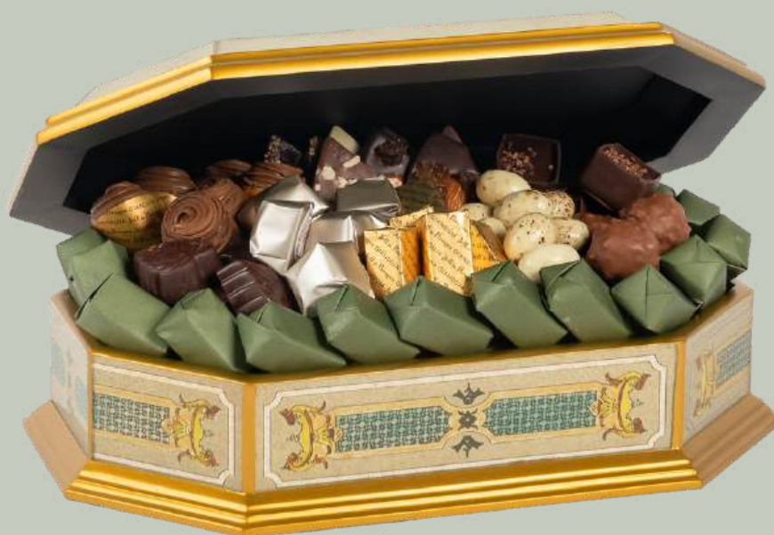
Ref0020 Boite Pérou octogonale PM L= 30 cm l = 20 cm H = 9 cm 850 g - 1 1 1