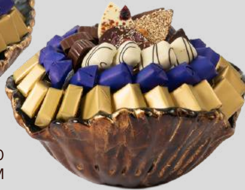
Ref0060 Murano gold blue PM L= 23 cm l = 23 cm H=10 cm 550 g - 1