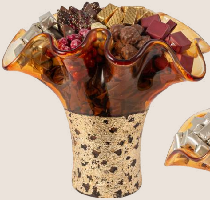
Ref0034 Vase Murano L= 29 cm l= 23 cm H= 30 cm 1150 g - 1 750 MAD