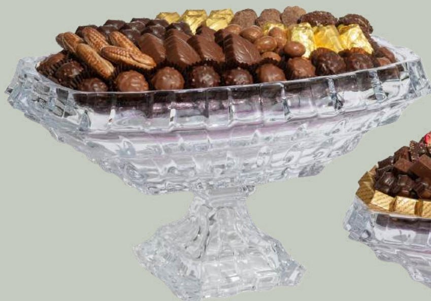
Ref0028 Coupe cristal rectangulaire sur pied L= 36 cm l = 21 cm H= 21cm 1300 g - 1 1 1