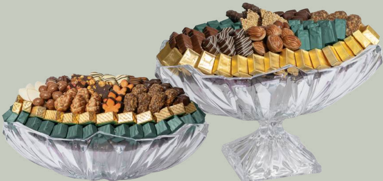
Ref0026 Coupe cristal ovale L= 36 cm l = 23 cm H = 12 cm 1100 g - 1 1