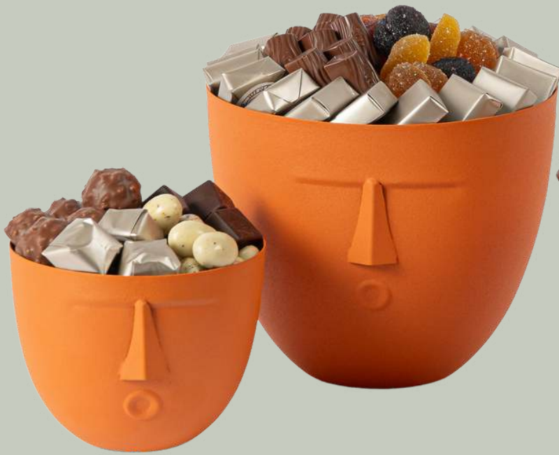
Ref0011 Pot tête PM Ø = 12 cm H= 10 cm 250 g - 320 MAD