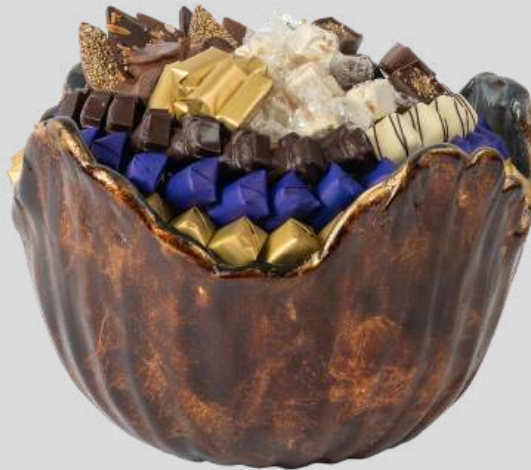
Ref0061 Corbeille Murano gold blue L= 30 cm l = 30 cm H= 20 cm 2000 g - 1 1 1