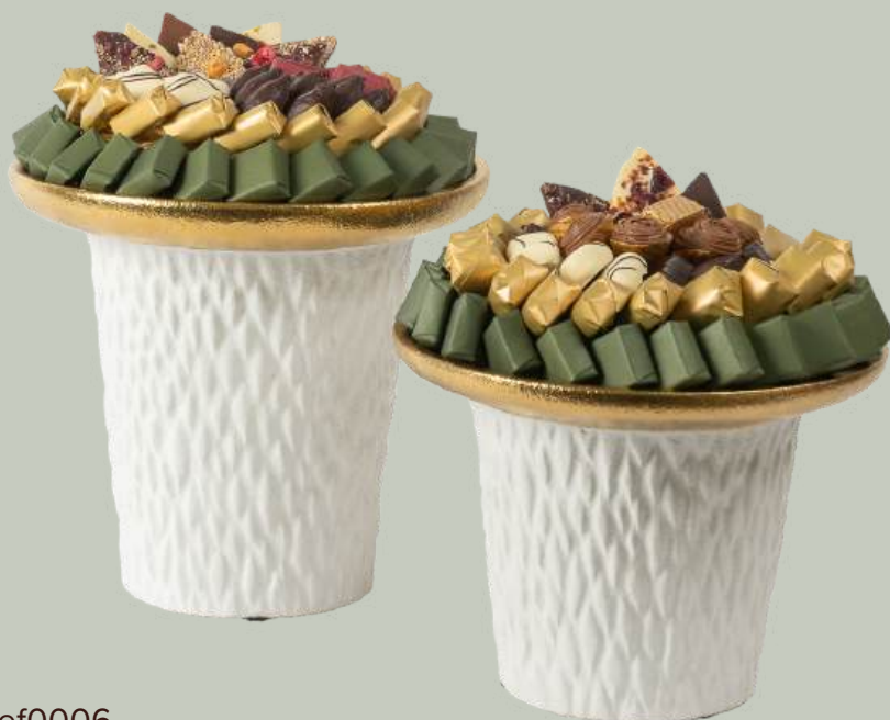
Ref0006 C ramique white gold GM   = 26 cm H=24 cm 950 g - 1 480 MAD