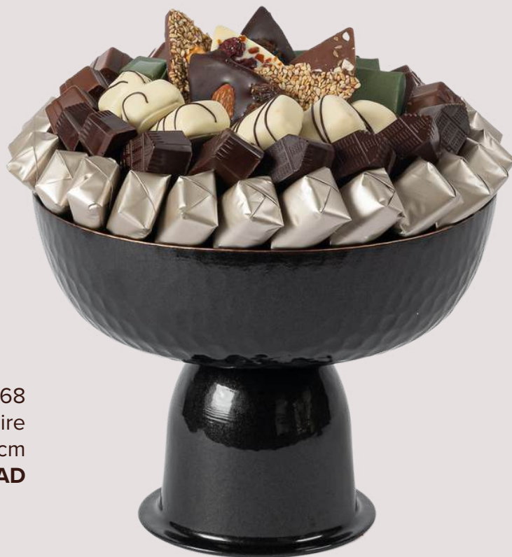
Ref0068 Coupe sur pied noire Ø = 21 cm H= 15 cm 750 g - 980 MAD