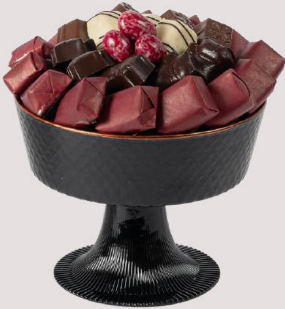
Ref0066 Coupe noire mate GM Ø = 21 cm H= 17 cm 750 g - 980 MAD