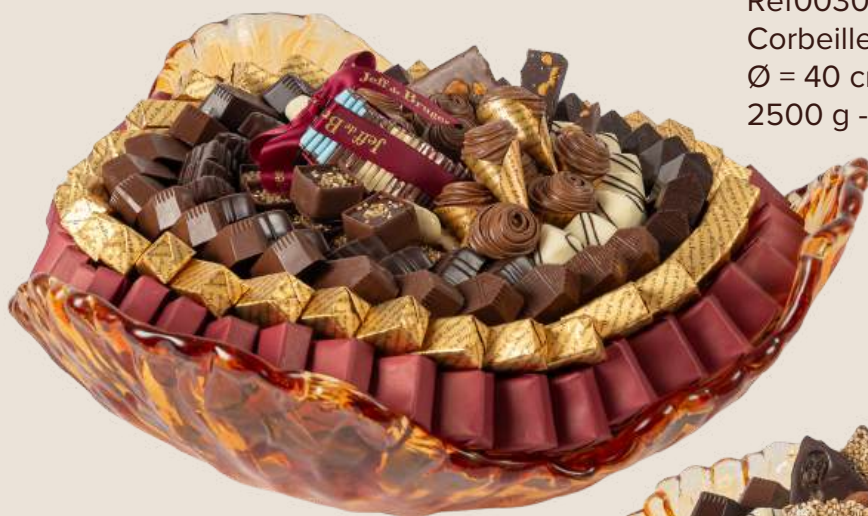
Ref0030 Corbeille Murano doré GM Ø = 40 cm H = 15 cm 2500 g - 3 380 MAD