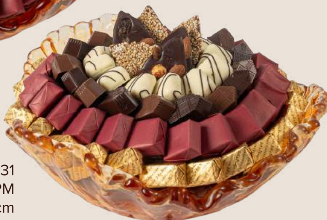
Ref0031 Corbeille Murano doré PM Ø = 28 cm H = 20 cm 1000 g - 1 580 MAD