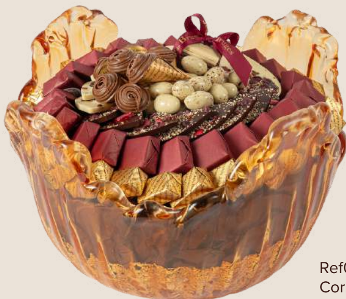
Ref0041 Corbeille Murano doré MM Ø = 32 cm H = 20 cm 2000 g - 2 680 MAD