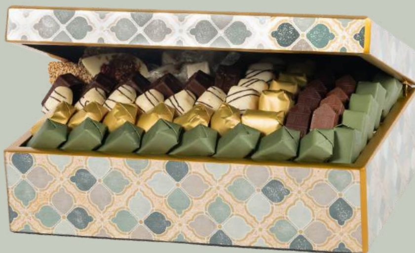
Ref0023 Boite Pérou carreaux GM L= 31 cm l = 23 cm H= 11 cm 1250 g - 1 1