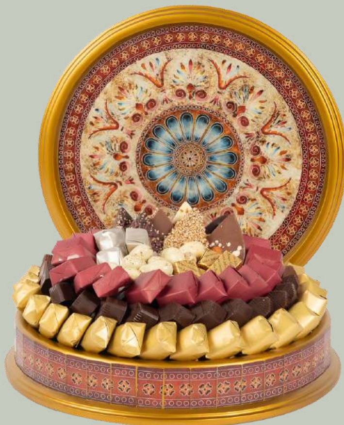
Ref0019 Boite Pérou ronde PM Ø = 24 cm H= 7 cm 600 g - 1 1