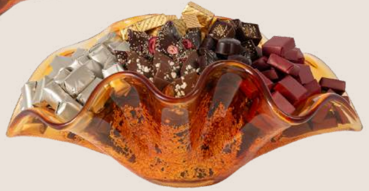
Ref0033 Coupe Murano L= 44 cm l= 29 cm H= 16 cm 2000 g - 2 850 MAD