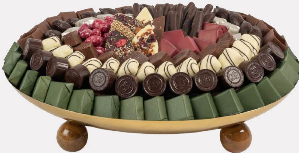
Ref0048 Coupe Inox ovale pieds bois PM L= 30 cm l= 25 cm H= 8 cm 1200 g - 1 750 MAD