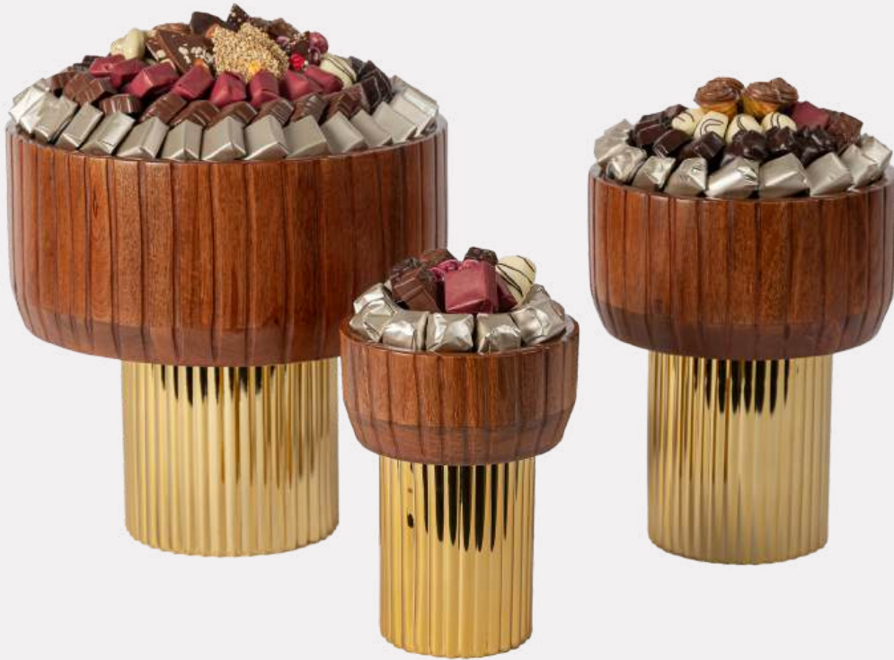
Ref0045 Coupe en bois sur pied GM Ø = 31 cm H= 29 cm 1750 g - 2 780 MAD