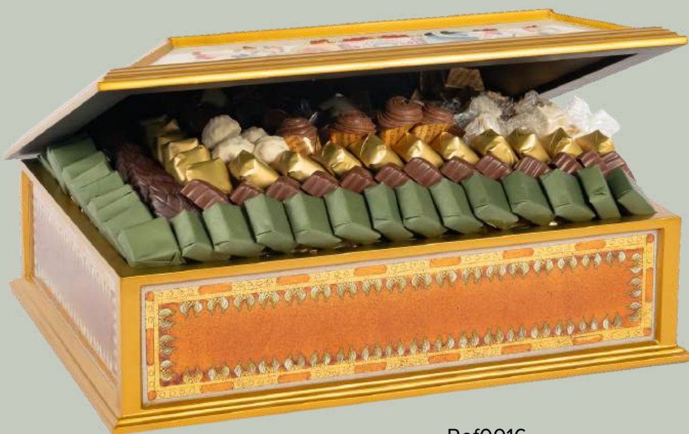
Ref0016 Boite Pérou L=40 cm l = 30 cm H = 15 cm 1800 g - 1 1