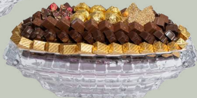
Ref0029 Coupe cristal rectangulaire L= 36 cm l = 21 cm H= 12 cm 1300 g - 1 1