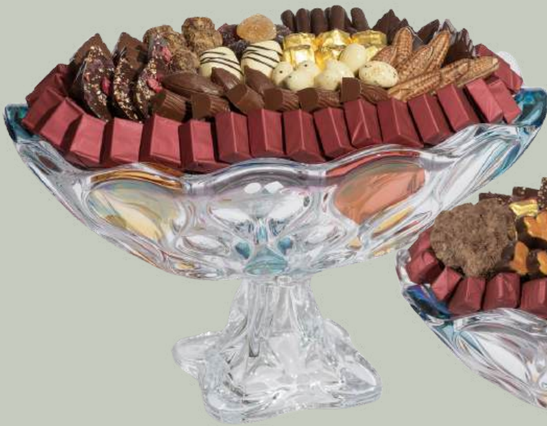
Ref0024 Coupe cristal colorée sur pied L= 36 cm l = 23 cm H= 22 cm 1300 g - 1 1